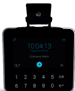
Exemple de MITO-03 installé sur le terminal X3