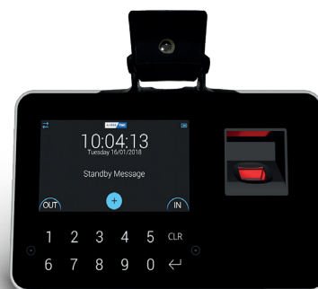
Exemple de MITO-03 installé sur le terminal X3 BIO